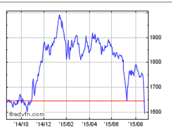
リート全銘柄の「時価総額加重型指数」の推移。基準時は 2003 年 3 月 31 日を 1,000。

○リートには元本価格の毀損を守る特別の仕組みはない お金が必要になって売るときに相場が 4,500 円ならば、一口当たり 500 円の損をしてしまいます。また、投資家の出資によって購入した不動産の所有者はリートです。リートが倒産した場合は債権者による処分の対象となります。